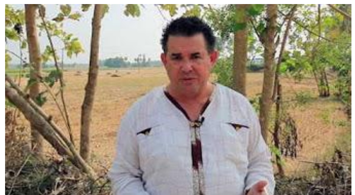
Een schitterende promo - acht jaar werk in 2.13 min. samengevat

Een speciaal woord van dank ook voor al die anonieme gevers, waar we helaas geen gegevens van hebben om ze te bedanken. Langs deze weg daarom een diepgemeend: Dank, dank, hartelijk dank! Kijk nog is even naar het onderstaande promotiefilmpje en besef dan dat u met u bijdrage een onmisbaar deel vormt van dit gezegende werk. En dat heb ik nog heel veel niet verteld. Enfin, u snapt dat het onmogelijk is om alles te vertellen.